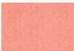
1001 DAIQUIRI MEL. 5%