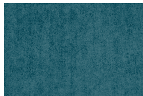
0680 ÍNDIGO POAL