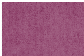
0909 VIOLETA POAL