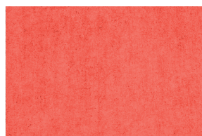
1002 CELTA CLARO POAL