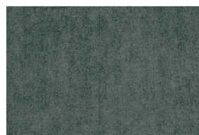
0416 VERDE MILITAR POAL