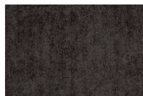
0493 BORGOÑA POAL