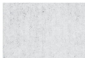
0021 BLANCO MEL. 5%