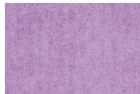
0210 LILA INTENSO POAL