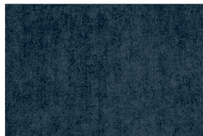
0501 MARINO POAL