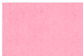
0240 MANEY POAL