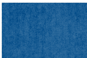
0904 FRANCIA INTENSO POAL