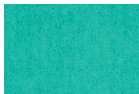
0398 GEMA POAL