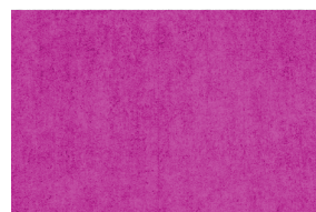
0716 FUCSIA INTENSO POAL