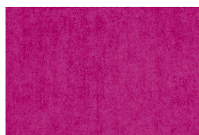
0716 FUCSIA INTENSO MEL. 5%