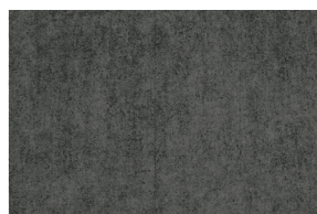
0980 TOPO POAL