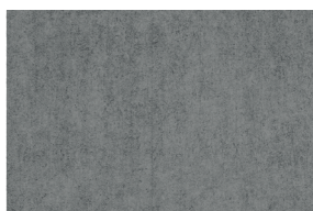
0021 MELANGE 25%