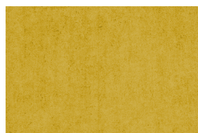
0140 MOSTAZA MEL. 5%