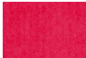
0902 ROJO BERMELLÓN POAL