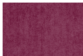
0701 BORDÓ POAL