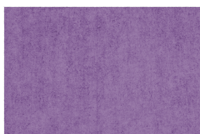
0210 LILA INTENSO MEL. 5%