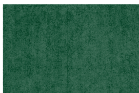
0688 VERDE INGLÉS POAL