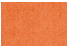
0492 ÓXIDO POAL