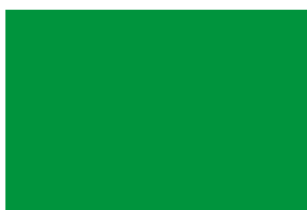
0399 VERDE TRÉBOL