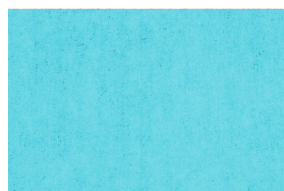
0113 TURQUESA POAL