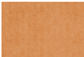
0490 CARAMELO POAL